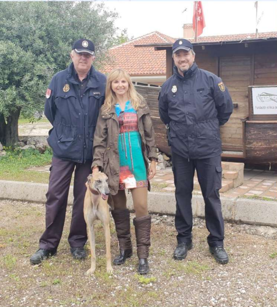
Visita de la Unidad de Guías Caninos de la Policía Nacional