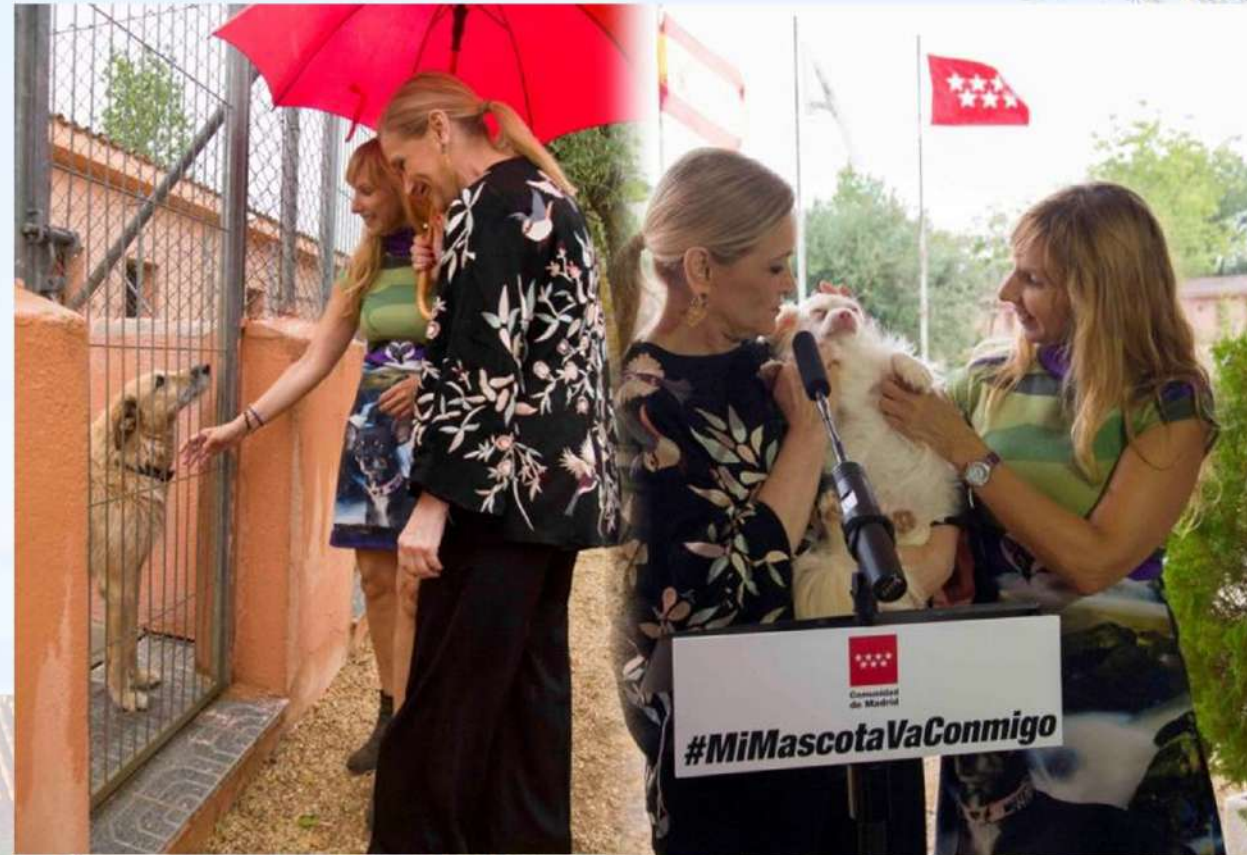
Expresidenta de la Comunidad de Madrid Sra. Doña Cristina Cifuentes